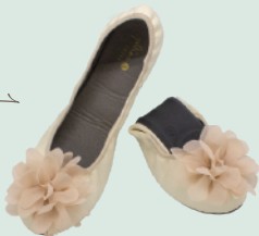
半分に折りたためる コンパクトなシューズ