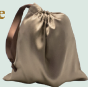
サテン地の付属ポーチ